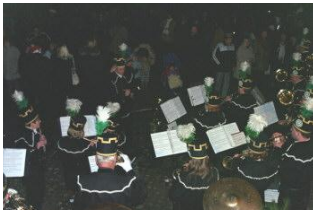
Konzert auf dem Thumer Weihnachtsmarkt

Hier könnte Ihre Werbung stehen. Eine Unterstützung der Thumer Kultur und des erzgebirgischen Brauchtums kann sich auch für Sie lohnen. Sprechen Sie mit uns.