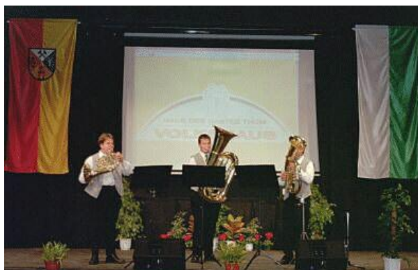
Die Bläserbesetzung bei ihrem Programm auf der Bühne

Wir nutzten die Chance gleich zweimal, einerseits unser Trio und zum Abschluss die Kapelle.