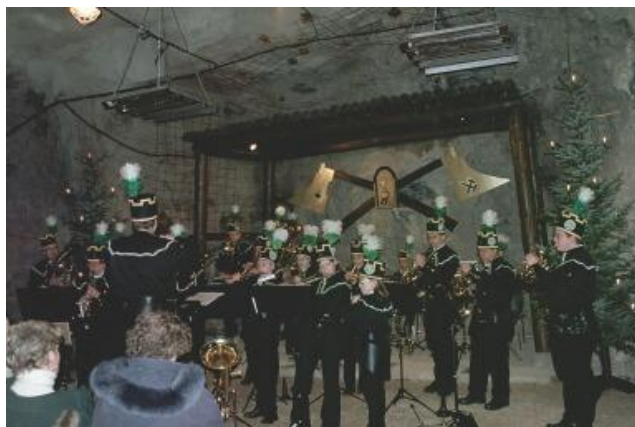
Zum Konzert im Besucherbergwerk Pöhla