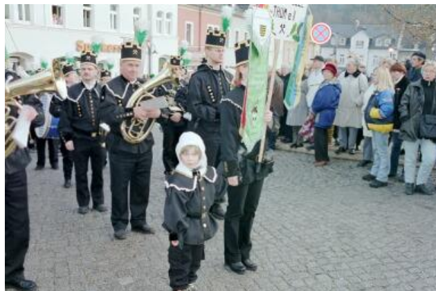
Bergparade in Thum